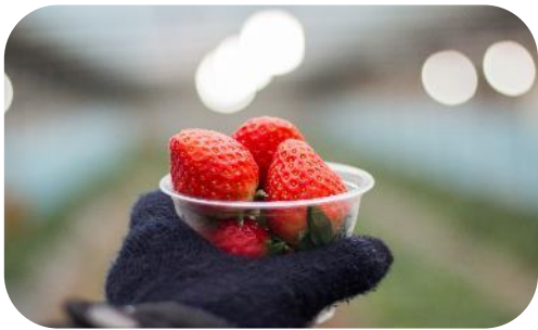
เที่ยง บริการอาหารกลางวัน ณ ภัตตาคาร เมนู...ที่คคาลปี

นำท่านเดินทางสู่ ไรสเตอร์วเบอร์รี่ ให้ท่านได้ชิมสตอเบอร์รี่สดๆ ด้วยสีส้มที่สดใสและรสชาติที่เยี่ยมยอดสตอเบอร์รี่เกาหลีจึงเป็นที่นิยมของคนทั่วโลกที่ต้องมาลองชิมสักครั้งนึง ( ปริมาณของสตอเบอร์รี่จะมีมากหรือน้อย ทั้งนี้ขึ้นอยู่กับสภาพอากาศ )