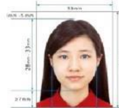
Paper Photo for Visa Application Form